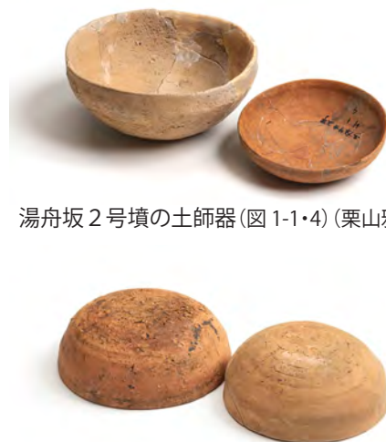
図2 湯舟坂2号墳の土師器(図1-1・4)