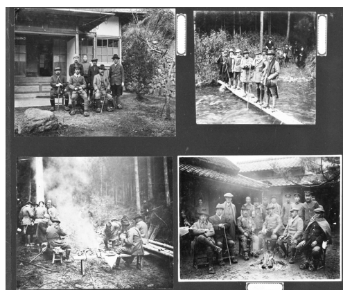
写真 2 両宮の御猟の写真を 4 枚 1 組で貼り付けたアルバム。（波多野六之丞家文書追加 1-18）